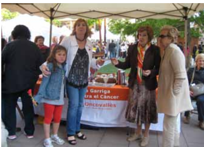
Ajuntament de Montornès del Vallès