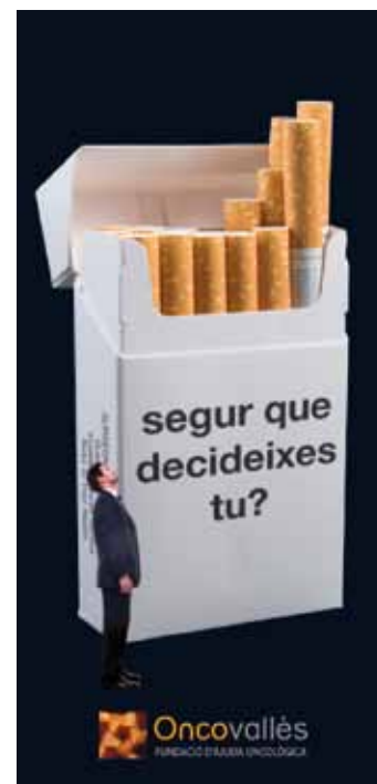
31 de maig Dia Mundial sense Tabac