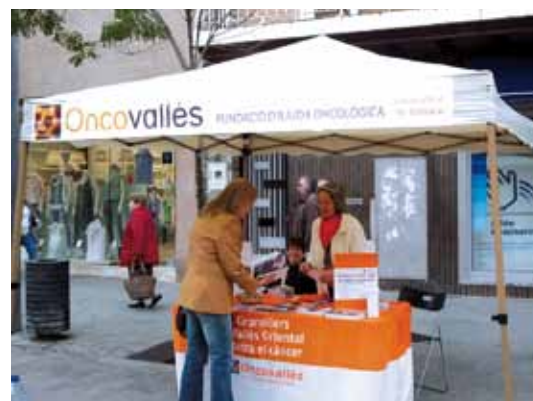
Taula informativa Granollers