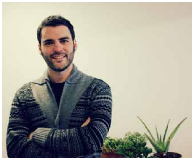
Esteve Plantada Periodista

Esteve Plantada va néixer a Granollers l'any 1979. És un granollerí d'excel·lència pluricultural. És la serenitat i el bon fer, virtuts avui en desús. Apassionat de la poesia, articulista, escriptor, ha escrit cinc llibres de poemes i ha guanyat diversos premis literaris, entre els quals el premi Amadeu Oller per a poetes inèdits de 1997. Exerceix com a crític literari en diferents mitjans. Els seus poemes també han estat inclosos en antologies i llibres conjunts, com ara Ningú no ens representa. Poetes empenyats (Setzevents, 2011), Poésie catalane: le voix ne dormant jamais (Exit, revue de poésie, Québec, 2010). Actualment és un dels editors d'Edicions Terrícola i coeditor del diari digital Nació -Granollers, on s'encarrega de coordinar la secció de cultura i opinió. També escriu cròniques culturals en diferents mitjans i