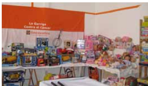
Joguines solidàries a La Garriga