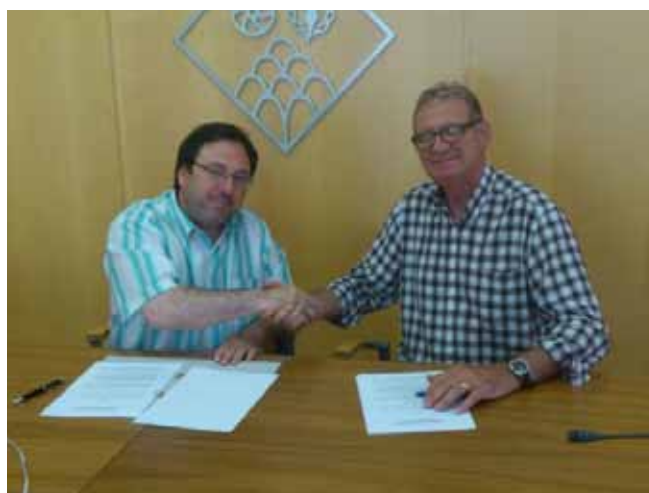
Ajuntament de Sant Feliu de Codines