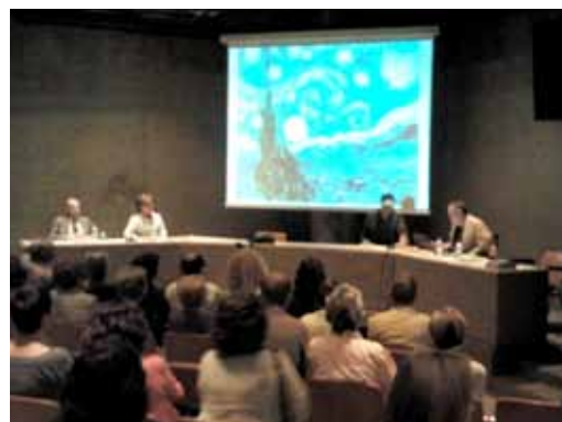
Per què fuma la gent? Conseqüències del tabac.