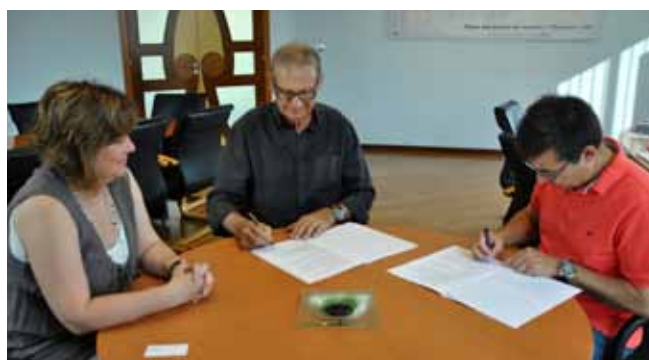
Ajuntament de Montmeló

Con el objetivo de mejorar las instalaciones en la que reciben ayuda los pacientes de cáncer y sus familias, Bruguera, la marca especializada en pintura decorativa, ha hecho una donación de 50 litros de pintura a la Fundació d'Ajuda Oncològica del Vallès (Oncovallès).