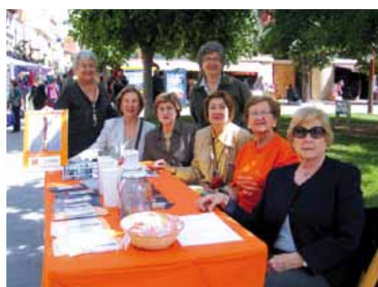
Taula informativa La Garriga