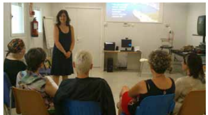
El manteniment del benestar emocional en el pacient de càncer