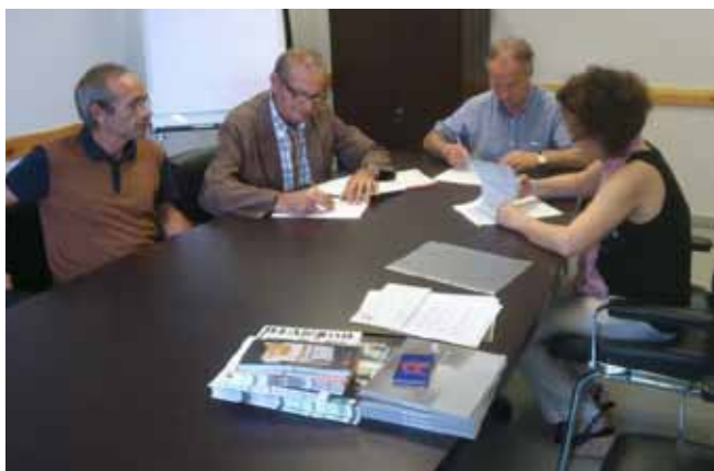
Ajuntament de Montornès del Vallès

Oncovallès segueix sumant amb els ajuntaments de la comarca, renovant els vigents i fent-ne de nous. La població i Oncovallès necessiten el vostre suport.