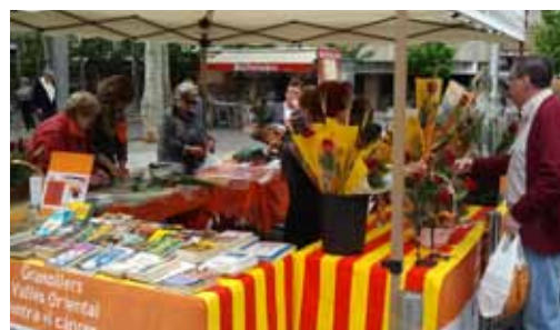
Libres reciclats per Sant Jordi a Granollers