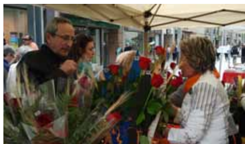
Roses per la vida a Granollers