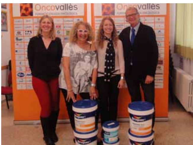
Pintura solidària (Bruguera)