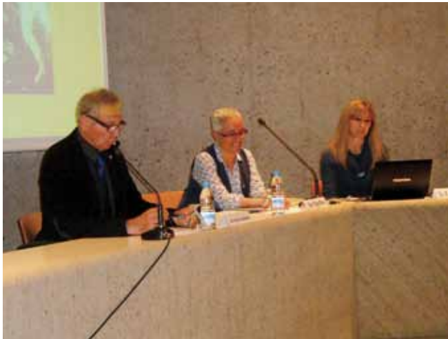
Eines de vida amb càncer colorectal.