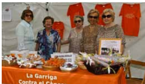
Fira d'entitats a La Garriga